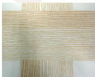
Due strisce di film L3: quella orizzontale, davanti, copre completamente i decori di quella verticale