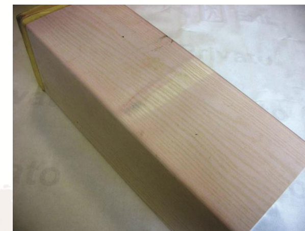
Profilo macchiato dagli inchiostri sublimatici dei precedenti cicli produttivi, penetrati attraverso il film a supporto L

Il supporto plastico L3 impedisce che residui di inchiostri sublimatici provenienti dall'esterno (per esempio dai supporti del forno di sublimazione intrisi di inchiostri dovuti a precedenti cicli produttivi) per il calore presente nel forno migrino attraverso il film plastico e sublimino così all'interno del manufatto, dando luogo a macchie o aloni.