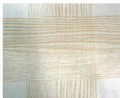
Strisce di film con supporto normale (L), sublimato una sopra l'altra su base bianca: i decori si sovrappongono parzialmente

- Per la decorazione di oggetti che richiedano la parziale sovrapposizione di tratti del film sublimatico, il supporto L3 impedisce il passaggio degli inchiostri attraverso entrambi gli strati di film, evitando così effetti di sovrapposizione del decoro e rendendo allo stesso tempo agevole la lavorazione.