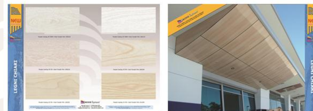
Finiture "Legni Bianchi" MRK-005-0168