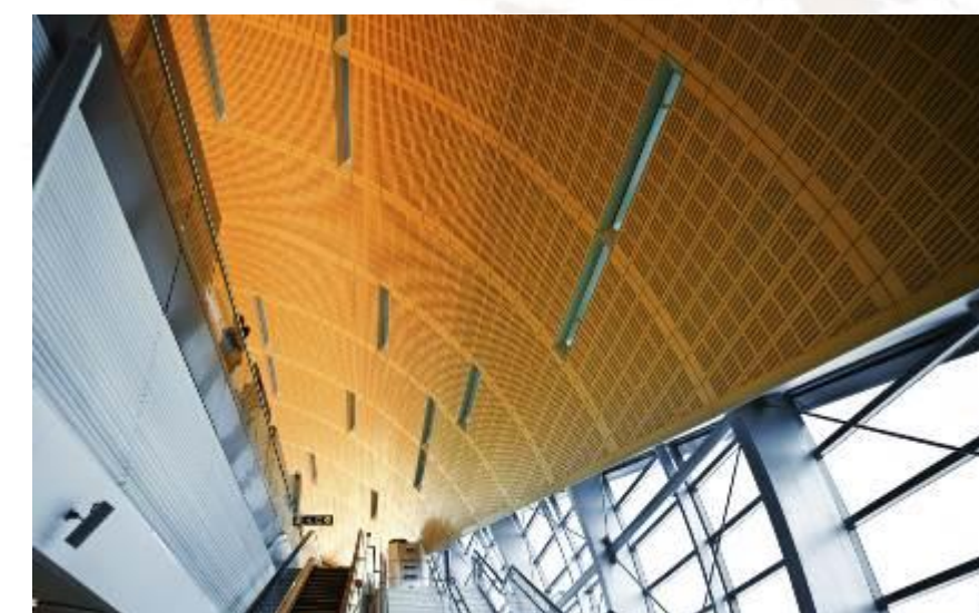
Controsoffittatura della metropolitana di Dubai

Le speciali proprietà meccaniche della serie 3C-XXX-A015 (PS-06XXP3) sono massimamente valorizzate nella produzione di controsoffitti, porte, oggetti d'arredo (architettura d'interni) e tutte quelle lavorazioni in cui la piegatura post-decorazione dei laminati risulta un'agevolazione del processo produttivo.