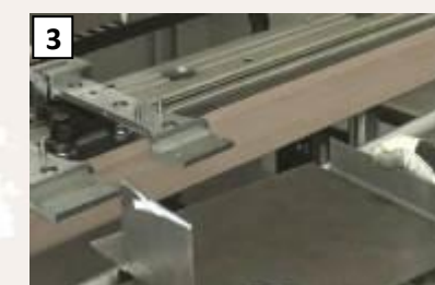
Piegatura delle lamiera decorate