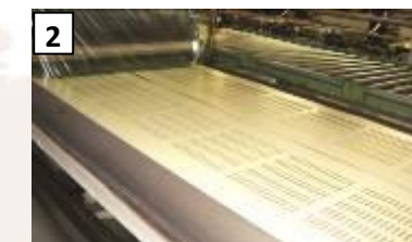
Decorazione di lamiera piane su pressa industriale