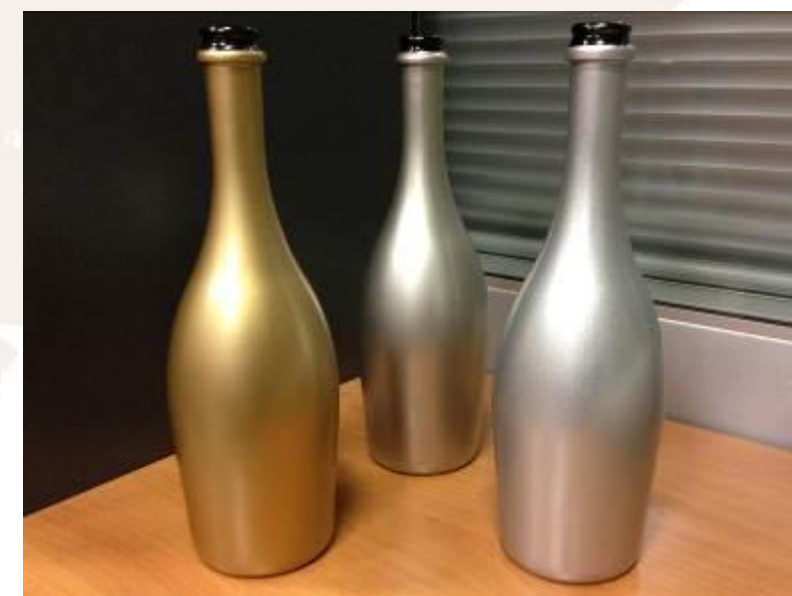
Da sinistra a destra, bottiglie decorate con Goldlook-001, Titanlook-001 e Silverlook-001

Con le polveri bonderizzate si possono ottenere particolarissimi effetti di lucentezza e metallizzazione. L'utilizzo di questi prodotti con la possibilità di un recupero non problematico della polvere costituisce un ulteriore valore aggiunto per questa serie.